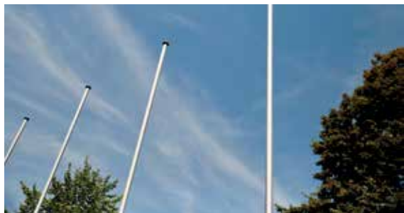
De vlaggenmasten aan de Kleiput