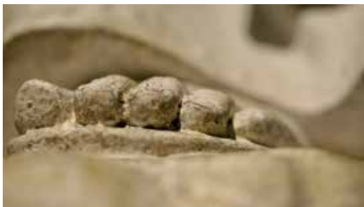
De tenen van het Mariabeeld aan de Kapel van het Niets